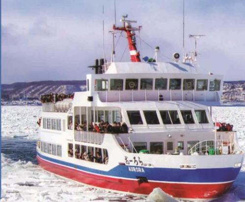
ล่องเรือตัดน้ำแข็ง