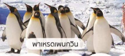
พาร์คไดเฟนกวิน